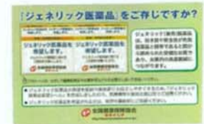
ジェネリック医薬品希望シール